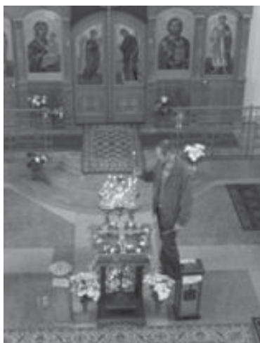
В праздник Воздвижения Креста Господня

Божией помощи всем нашим батюшкам в их спасительных трудах!