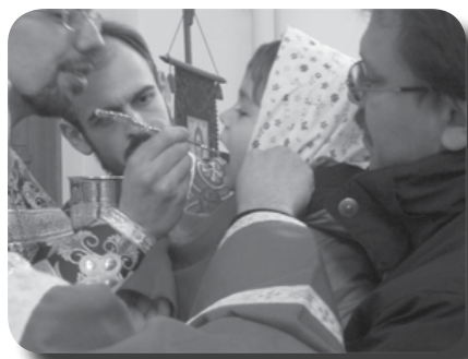
Причащается Раба Божия...