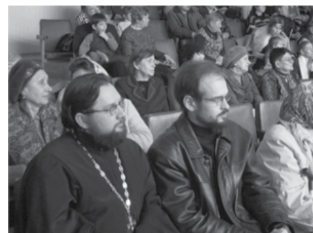
От сердца к сердцу