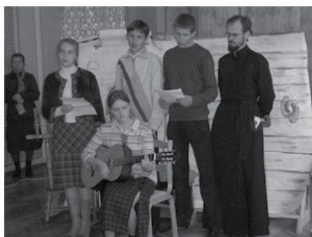
Праздничный концерт. Выступление старших ребят из Молодежной группы в день открытия воскресной школы