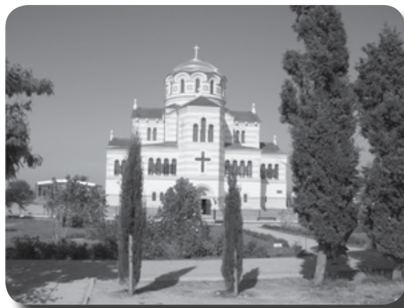
Херсонес. Владимирский собор.

офан Грек действительно работал в Кафе, но ранее считалось, что его крымские росписи не сохранились. Сюжеты фресок читаются с трудом, роспись нуждается в серьезной реставрации. По подсчетам экспертов, на полное восстановление средневекового храма и его фресок понадобится не менее 12 миллионов долларов. Пока таких денег нет, и фрески остаются в таком плачевном виде. В храме служат литургию один раз в год, 8 ноября, в день памяти Димитрия Солунского. В остальное время можно войти в храм, полюбоваться. Мы попали как раз в тот момент, когда там находился человек, занимающийся делами храма, и он подробно рассказал нам историю, показал всё, даже разрешил потрогать фрески. И правда, на ощупь они тёплые. Он сказал, что ещё бы столько же лет продержались фрески в первозданном виде, если бы не человеческое вмешательство.