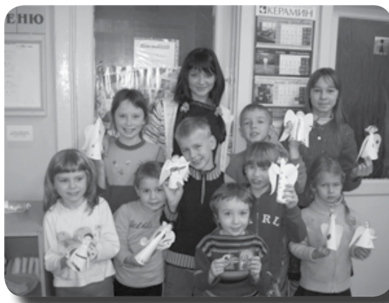
Ангел хранитель с нами

21 ноября , в день празднования Собора Архистратига Михаила и всех бесплотных сил, мы с учениками старшей группы воскресной школы ходили в гости к нашим подопечным из социального приюта. Нам здесь были очень рады. Встреча началась с рассказа о том, что каждому человеку при крещении Бог дарует ангела-хранителя, который охраняет нам на жизненном пути. Мы спели песню об анге-