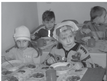
Обед перед началом занятий в младшей группе воскресной школы