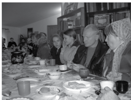
Воскресные беседы с чаепитием