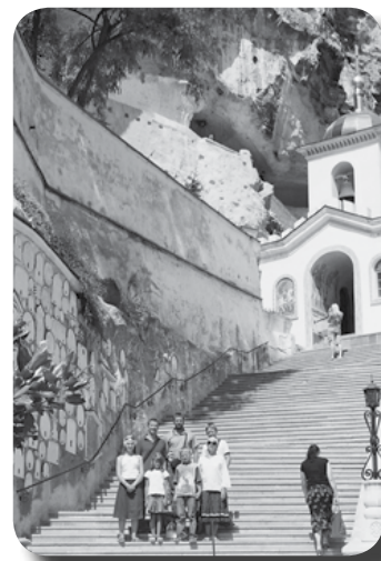
Бахчисарайский Успенский монастырь

Бахчисарайский Успенский монастырь является пещерным монастырём. Он основан греками — иконопочитателями. История его во многом трагична, особенно пострадал монастырь в советское время. Но теперь по милости Божией заново строится, насельники стекаются в него из разных уголков земли. В монастыре хранится чудот-