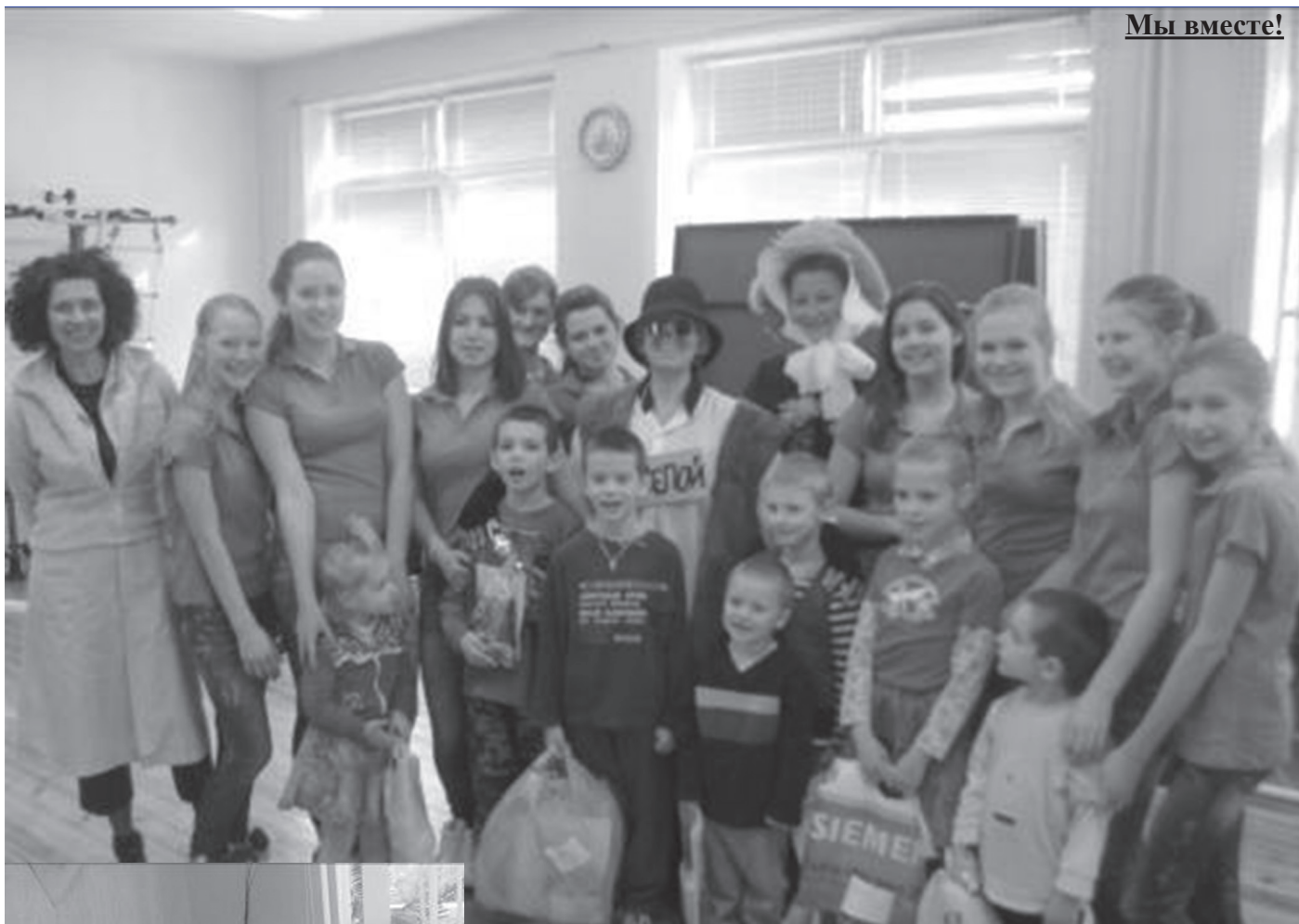
В детском приюте