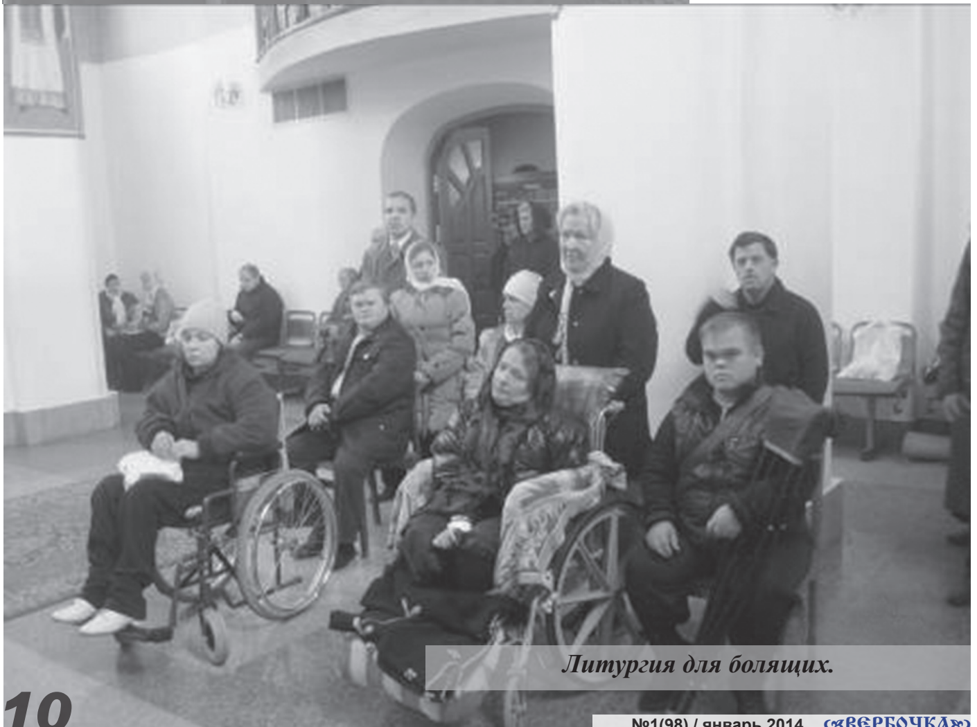
Литургия для болящих.